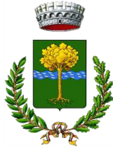
Comune di Cerro al Lambro