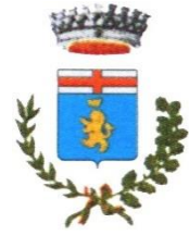
Comune di Vizzolo Predabissi

All' Agenzia del Trasporto Pubblico Locale del bacino della Città Metropolitana di Milano, Monza e Brianza, Lodi e Pavia e-mail: osservazioni.programmatpl@agenziatpl.it PEC: luca.tosi@pec.agenziatpl.it