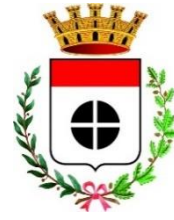
Comune di Melegnano